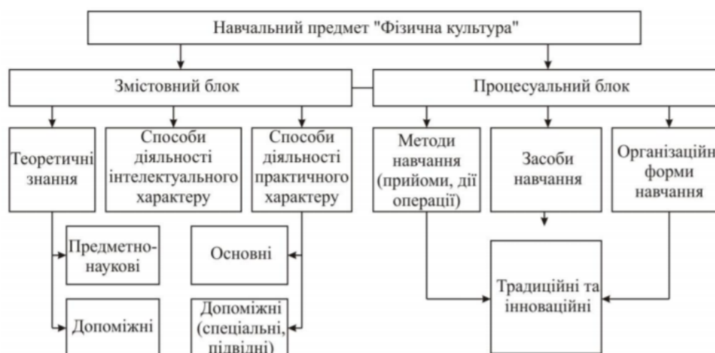
Рис. 2. Структура навчального предмету «Фізична культура»

Фізична культура як навчальний предмет викладається в усіх класах. На уроках учитель створює відповідні умови для розв'язання поставлених завдань і спрямовує учнів до самостійної діяльності (Рис. 2).