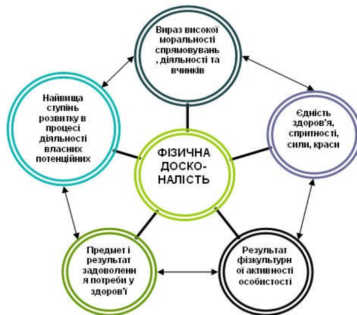
Рис. 3. Структура фізичної досконалості

Саме завдяки педагогу-професіоналу учні мають змогу отримувати якісний рівень знань, умінь, оволодівають загальною структурою фізичної активності, навчаються, розвиваються відповідно до своїх можливостей.